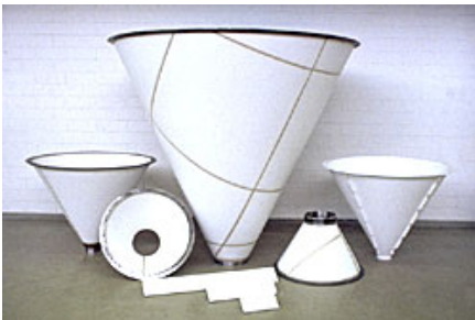
Belüftungsböden und -trichter